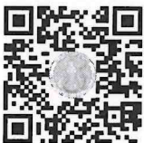
เอกสารแนบ ๑

ปฏิบัติราชการแทนปลัดกระทรวงเกษตรและสหกรณ์