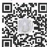
แบบฟอร์มรายงาน