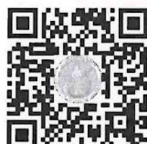
เอกสารแนบ ๒